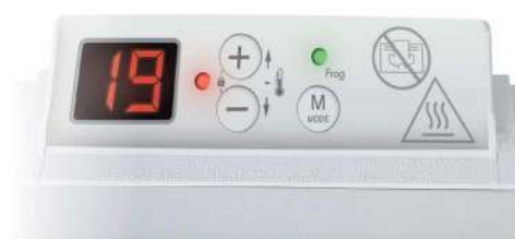
Vyhovuje evropské ekodesign směrnici ERP 2018