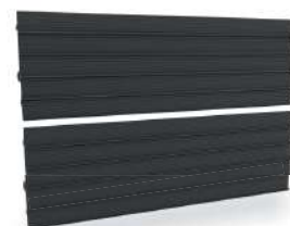
Topný blok Airalu®

Úsporné sálavé předávání tepla pomocí velkoplošného topného elementu ze slitiny hliníku. Navržené speciální žebrování pro zesílení emisivity ve prospěch lepšího vyzařování tepla.